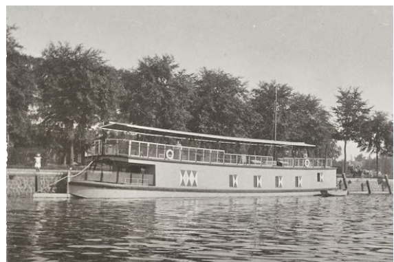
Le Fafner à quai à Flessingue, 1902