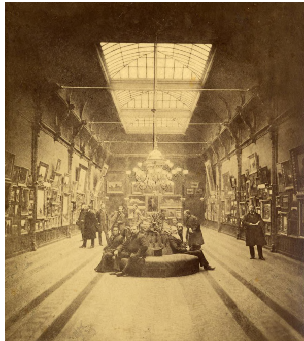
Afbeelding links: catalogus van de tentoonstelling Baertsoen, Claus Meunier in de Pulchri Studio in Den Haag, 1892. Afbeelding rechts: de tentoonstellingsruimte van de Pulchri Studio, ca. 1890

Om in alle vrijheid in Zeeland te kunnen werken, liet Baertsoen in 1897 de Fafner bouwen, een luxueuze woonboot waarmee hij de zomers doorbracht in Vlissingen, Veere en Middelburg. Baertsoen schilderde er lichtrijke doeken in een opvallend helder coloriet, heel anders van toon dan het werk dat hij in en rond de Vlaamse steden produceerde. Ook de stadskanalen van Dordrecht en Amsterdam wisten hem te inspireren. Net voor de Eerste Wereldoorlog bracht hij de Buitenhaven van Terneuzen via tekeningen, etsen en werken in olieverf uitgebreid in beeld.