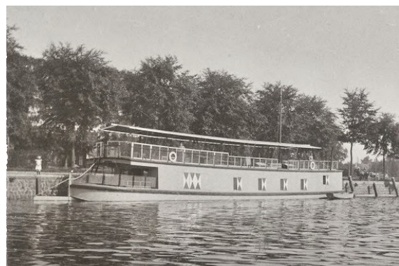
De Fafner aan de kade in Vlissingen, 1902

Om in alle vrijheid in Zeeland te kunnen werken, liet Baertsoen in 1897 de Fafner bouwen, een luxueuze woonboot waarmee hij de zomers doorbracht in Vlissingen, Veere en Middelburg. Baertsoen schilderde er lichtrijke doeken in een opvallend helder coloriet, heel anders van toon dan het werk dat hij in en rond de Vlaamse steden produceerde. Ook de stadskanalen van Dordrecht en Amsterdam wisten hem te inspireren. Net voor de Eerste Wereldoorlog bracht hij de Buitenhaven van Terneuzen via tekeningen, etsen en werken in olieverf uitgebreid in beeld.