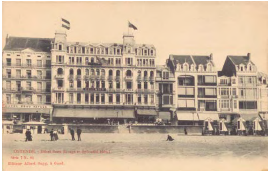
De Villa des Hirondelles op de Zeedijk in Oostende (laatste woning rechts op de foto), ca. 1900.

Het gros van het fortuin bestond echter uit een aandelenportefeuille. De nominale waarde hiervan beliep ca. 2.050.000 fr., waarvan 1.750.000 frank aandelen in de SA Baertsoen-Buysse. Gezien de aanhoudende groei en goede bedrijfsresultaten van de onderneming, kan worden verondersteld dat de reële waarde van dit pakket aanzienlijk hoger lag.