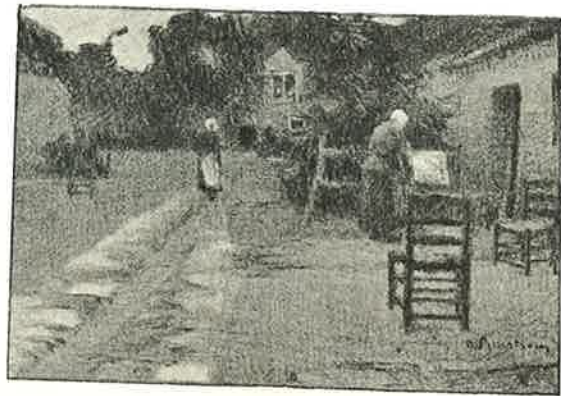
AVOND IN 'T GODSHUIS

Om het anders uit te drukken : Claus is de schilder van zeker , Baertsoen die van een ander licht. Geen is de lumieniest van een